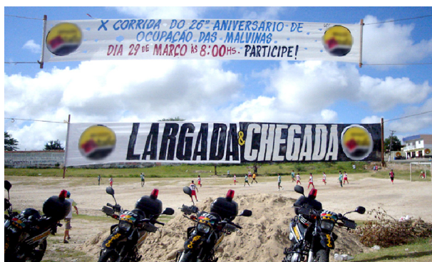
Imagem 07: Faixa do evento comemorativo e ao fundo partida de futebol com moradores das Malvinas.